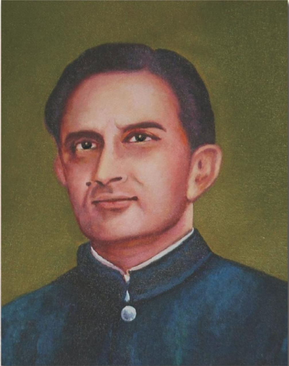
Vikram Ambalal Sarabhai